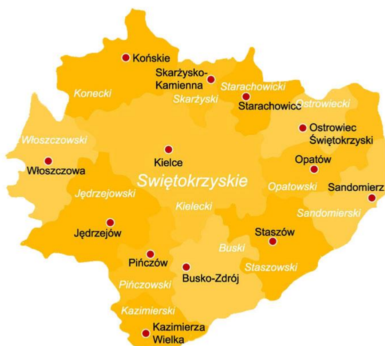
Mapa: Położenie gminy Sandomierz na tle województwa świętokrzyskiego oraz powiatu sandomierskiego

Powierzchnia miasta to 2 869 ha (blisko 29 km 2 ), co stanowi 4,2% powierzchni powiatu (676 km 2 ). Według danych GUS miasto zamieszkuje 23 863 osób, przeciętnie około 832 osób na km 2 . Jednym z głównych negatywnych zjawisk społecznych obserwowanych na terenie Sandomierza, jest stale zmniejszająca się liczba mieszkańców oraz zmiana zachodząca w strukturze ludności. Liczba mieszkańców Sandomierza w ciągu okresu 5 lat 2013 - 2017 zmalała o 689 osób, tj. 2,81% ogółu mieszkańców względem stanu z 2013 r. Tendencja spadkowa ma charakter stały. W zakresie zmiany struktury wiekowej ludności, obserwuje się stały trend wzrostu liczby osób w wieku poprodukcyjnym (60 i więcej lat w przypadku kobiet oraz 65 i więcej lat w przypadku mężczyzn), który w okresie 5 lat wyniósł 552 osób z poziomu 5189 osób do 5741 osób, przez co odsetek osób w wieku poprodukcyjnym wzrósł z poziomu 21,13% ogółu mieszkańców do 24,05%. Znamienny jest także duży ubytek ludności w wieku produkcyjnym. Liczba ludności w tym przedziale wiekowym zmniejszyła się w ciągu 5 lat aż o 912 osób, przez co ich liczba w ogólnej strukturze mieszkańców miasta zmalała z poziomu 62,67% do 60,65%. Maleje również liczba ludności w wieku przedprodukcyjnym, która zmniejszyła się o 329 osób w stosunku do roku 2013., jednak zmiana ta nie jest tak znacząca jak w grupie poprodukcyjnej. Oznacza to starzenie się struktury demograficznej miasta i pojawienie się problemu zastępowalności pokoleń.